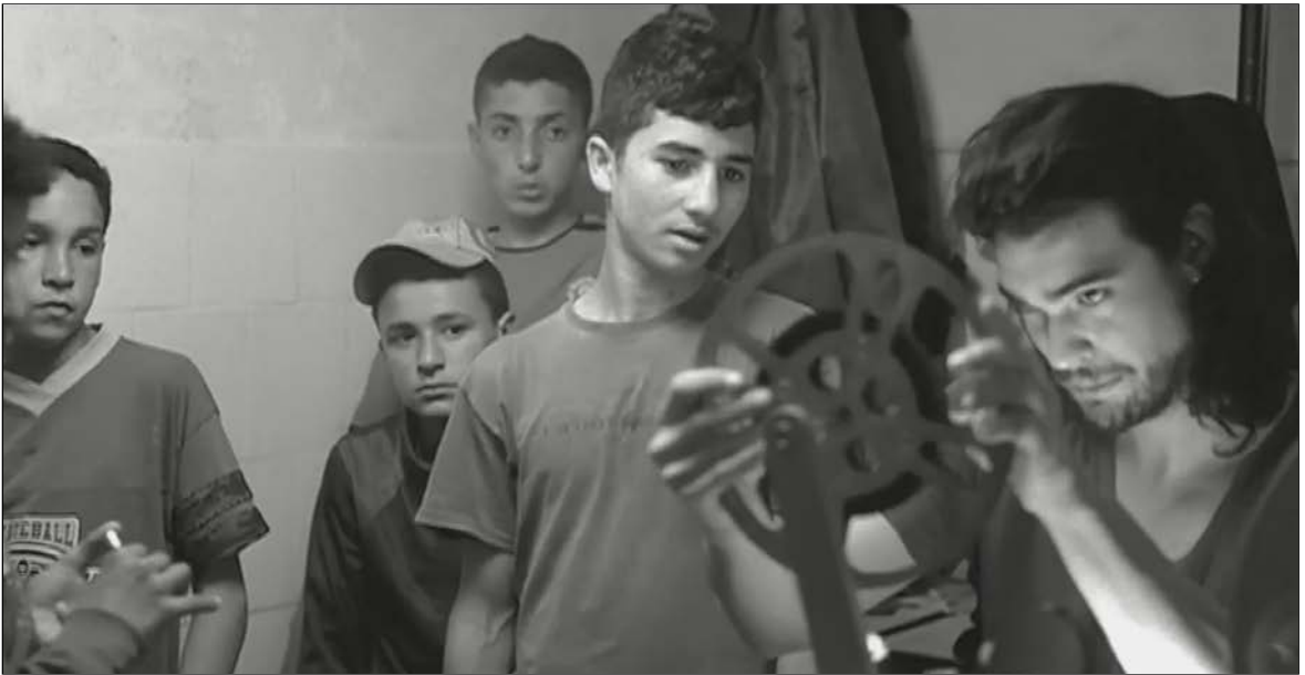
Fotograma da película Todos vós sodes capitáns

lume lento. Fíxate, esta película si que vai ser moito máis popular, moito máis de xénero, vou traballar con actores, e estou tratando de entender cal é o ADN da película, se é francesa, española ou unha fusión. A película fala de Europa, en realidade, da Ilustración, destes tempos, de cinismo pero tamén de desacralización. É sobre un grupo que anda pola trintena, que son punks ou tranceiros , non sei como dicilo, que viven nas festas trance todo o ano. E reciben unha mensaxe de texto dunha festa en Marrocos. En realidade é unha película moi similar a Mimosas . É unha aventura. Eles van cara ao sur e, mentres, vense os efectos dunha guerra que está pasando en Europa. Ademais de ser unha épica exterior, é tamén unha épica interior, unha viaxe iniciática. Esta película vaime marcar se quero seguir subindo ou non, porque para despois estou pensando en traballar nunha serie de televisión. Apetéceme moito facer algo seriado. Hai un cam-